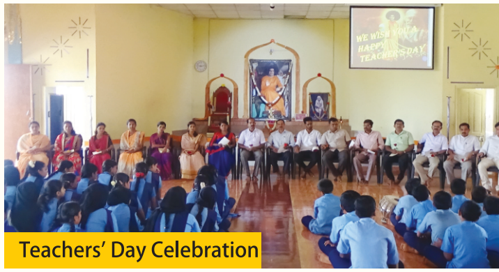
Teachers' Day Celebration