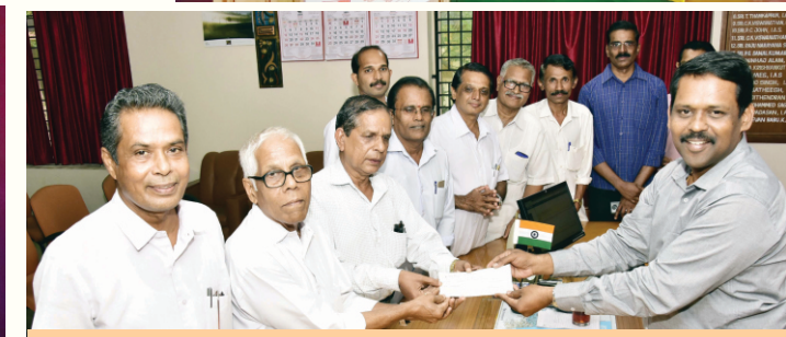
Sathya Sai Seva Samithis of Kasaragod And Prashanthi Vidya Kendra Bayar donated Rs, 75000.00 to the District Collector towards the kerala Chief Minister Distress Relief Fund

"The end of knowledge is Love. The end of education is character."