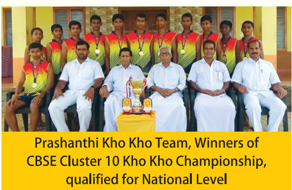
Prashanthi Kho Kho Team, Winners of CBSE Cluster 10 Kho Kho Championship, qualified for National Level