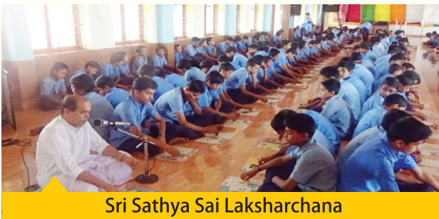
Sri Sathya Sai Laksharchana