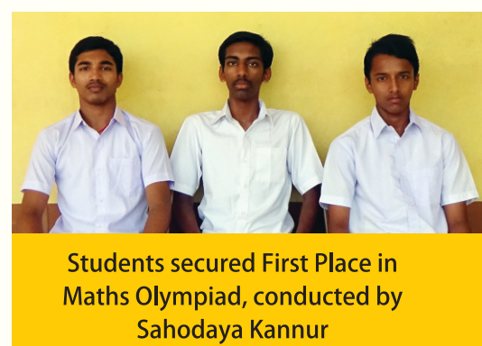
Students secured First Place in Maths Olympiad, conducted by Sahodaya Kannur