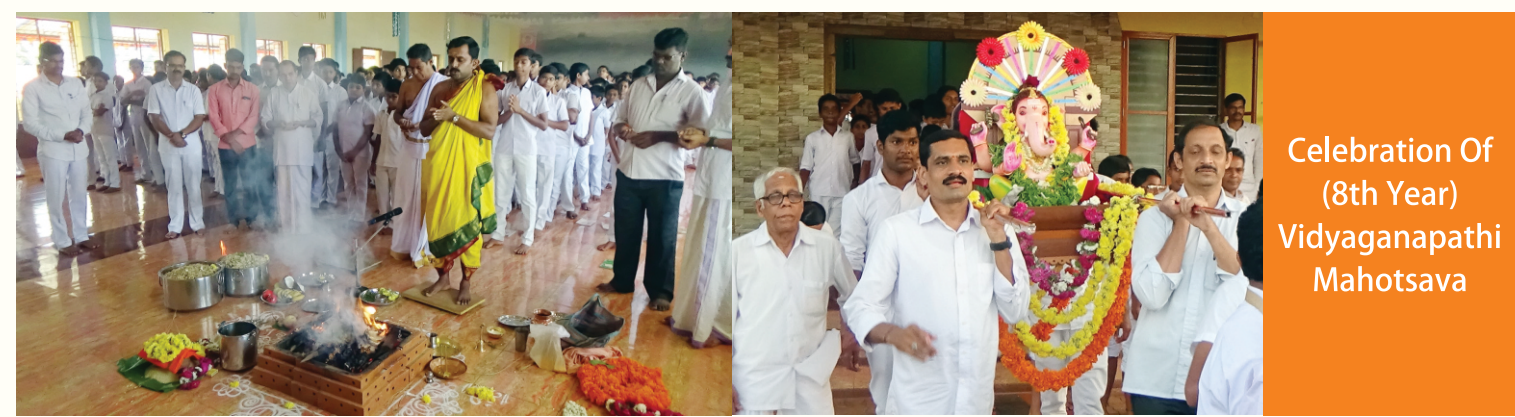
Celebration Of (8th Year) Vidyaganapathi Mahotsava