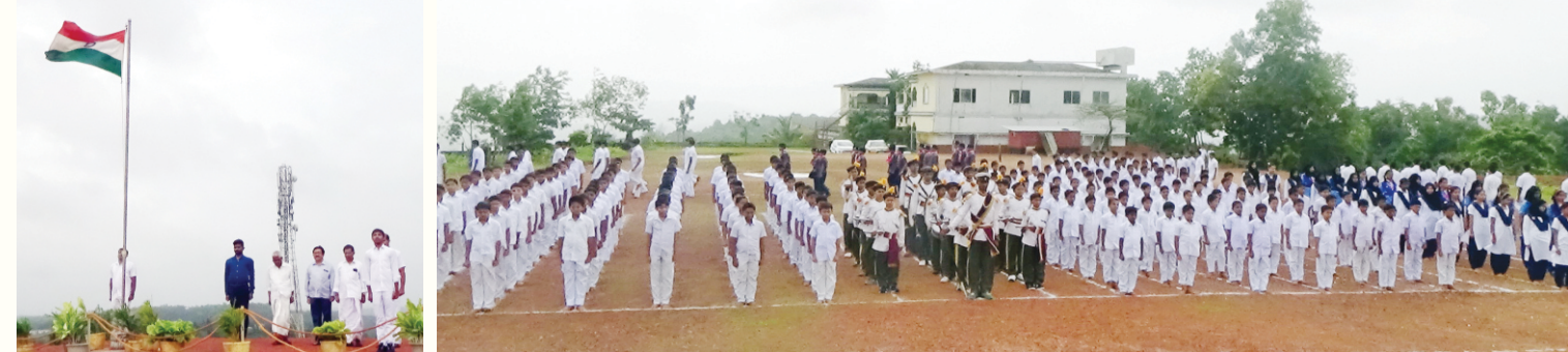
72nd Independence Day Celebration

ಪ್ರಶಾಂತಿ ವಿದ್ಯಾ ಕೇಂದ್ರ, ಬಾಯಾರು | ಜುಲೈ-ಸೆಪ್ಟೆಂಬರ್ 2018 ಸಂಪುಟ 04 | ಸಂಚಿಕೆ 02 | ಪುಟ 04