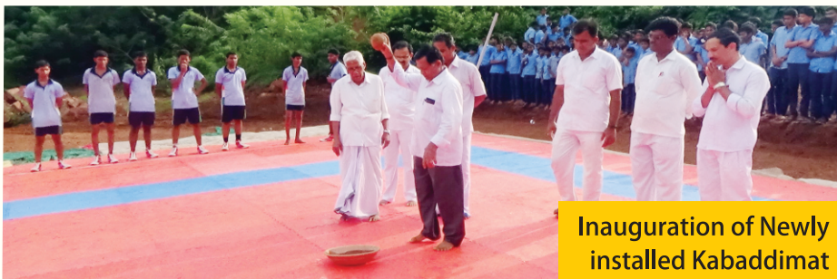
Inauguration of Newly installed Kabaddimat